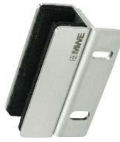
Bodenführung für Schrankebefestigung Modell ST-4006.S bis 4012.S Floor guiding rail for cabinet fastening Model ST-4006.S to 4012.S