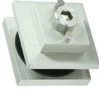
Wandbefestigung Modell Akzent Modell ST.2170.AK Glass fastening Akzent Model ST.2170.AK premium edition