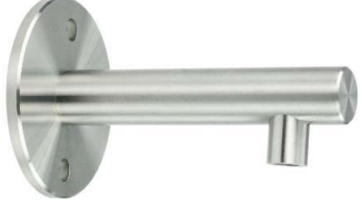
Deckenhalter ohne Höhenverstellung Modell ST.5003 Ceiling fastening without adjustable height Model ST.5003