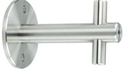
Deckenhalter ohne Höhenverstellung Modell ST.5004 Ceiling fastening without adjustable height Model ST.5004