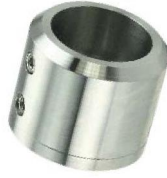
Stirrsitenbefestigung für Laufschiene Ø 25 mm Modell ST.5035 Running rail front end fastening Ø 25 mm Model ST.5035