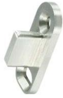
Bodenführung für Holztürblatt Modell ST-4005 Floor guiding rail for wooden door leaf Model ST-4005