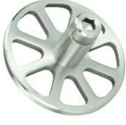
Wandbefestigung Spider Modell ST.2133.SP Wall fastening Spider Model ST.2133.SP premium edition