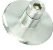
Wandbefestigung für Rundlaufschiene Modell ST.2100 Wall fastening for curved running rails Model ST.2100