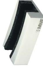
Bodenführung für gebogene Türblätter, Radius nach Kundenangabe Modell ST-4006.R bis 4012.R Floor guiding rail for curved door leaves, radius according to customers specifications Model ST-4006.R to 4012.R