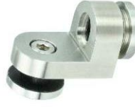
Glas-Boden/Deckenhalter mit Höhenverstellung Modell ST.7001.V Glass-to-floor/ceiling fastening with adjustable angles Model ST.7001.V