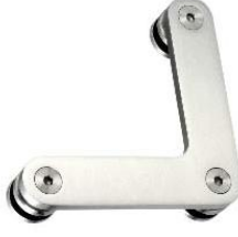
Seitenverbinder Modell ST.7003 Connector Model ST.7003