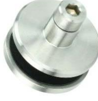
Glasbefestigung für Rundlaufschiene Modell ST.2170 / ST.2170.VA Glass fastening for curved running rails Model ST.2170 / ST.2170.V