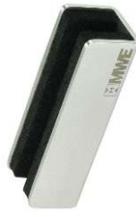
Bodenführung für Glas Modell ST-4006 bis 4012 Floor guiding rail for glass Model ST-4006 to 4012