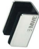
Bodenführung für gebogene Türblätter, große Radien Modell ST-4006.40 - ST-4012.40 Floor guiding rail for curved door leaves, big radius Model ST-4006.40 - 4012.40