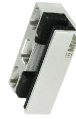
Bodenführung für Schloss rund Modell ST-4008.SR bis 4012.SR Round floor guiding rail for key lock Model ST-4008.SR to 4012.SR