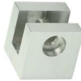
Stirrsitenbefestigung für Laufschiene Alzent L 40 x 10 mm Modell ST.5040 AK Accent running rail front end fastening Ø 40 x 10 mm Model ST.5040 AK premium edition