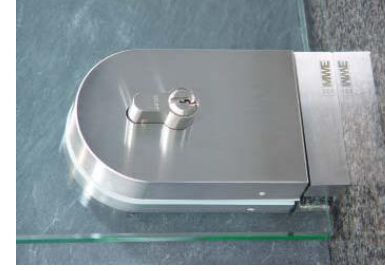
Bodenschloss rund Modell ST.4100.SR Round floor lock ST.4100.SR