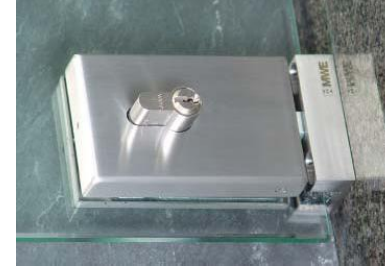
Bodenschloss rechteckig Modell ST.4100.SE Rectangular floor lock ST.4100.SE