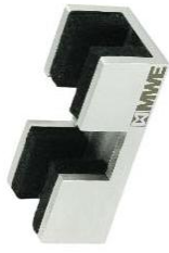
Bodenführung Modell ST-4006.AK bis 4012.AK Floor guiding rail Model ST-4006.AK to 4012.AK premium edition