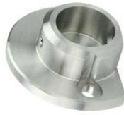
Stirrsitenbefestigung für Laufschiene Ø 25 mm Modell ST.5010 Running rail front end fastening Ø 25 mm Model ST.5010