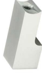
Befestigung auf Schrank für Laufschiene Ø 20 und 25 mm Modell ST.2135.20.MM / ST.2135.25 Running rail fastening for cabinets Ø 20 and 25 mm Model ST.2135.20.MM / ST.2135.25