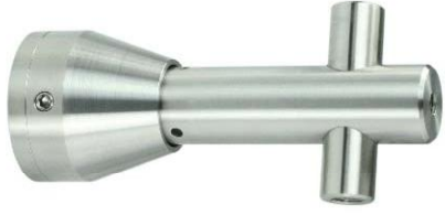
Deckenhalter, +/- 4 mm Höhenverstellung möglich Modell ST.5002 Ceiling fastening, adjustable height of +/- 4 mm Model ST.5002