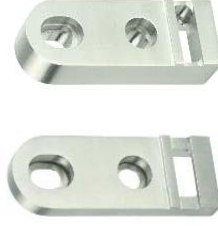
Wandbefestigung mit Verstellmöglichkeit Modell ST.2183.22 / ST.2183.32 Adjustable wall fastening Model ST.2183.22 / ST.2183.32