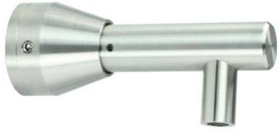
Deckenhalter, +/- 4 mm Höhenverstellung nach Montage möglich Modell ST.5001 Ceiling fastening, adjustable height of +/- 4 mm after installation Model ST.5001