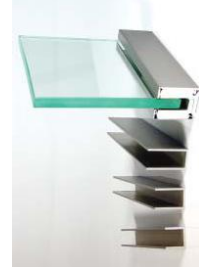
U-Profil Modell ST.4015.U - ST.4040.U U-profiles Model ST.4040, - U-4040.U