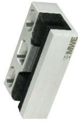
Bodenführung für Schloss weckige Modell ST-4008.SE bis 4012.SE Rectangular floor guiding rail for key lock Model ST-4008.SE to 4012.SE