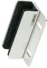
Bodenführung für Schrankebefestigung Modell ST-4006.U bis ST-4012.U Floor guiding rail for cabinet fastening Model ST-4006.U to ST-4012.U