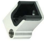
Bodenstopperr Modell ST-4508 / ST-4510 / ST-4512 Floor stopper Model ST-4508 / ST-4510 / ST-4512