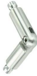
Laufschiene-Eckverbinder mit Winkelverstellmöglichkeit für Ø 25 mm Modell ST.2090 Running rail corner connection assembly with adjustable angles for Ø 25 mm Model ST.2090