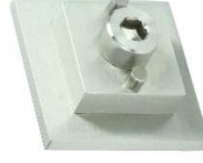
Wandbefestigung Modell ST.2140.AK Wall fastening Model ST.2140.AK premium edition